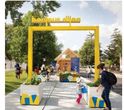
Arche d'entrée avec bacs de plantation Rue de Dijon, Montréal Nord (2016)

A long terme, l'aménagement des espaces publics de façon temporaire permet une évolution de ces espaces centraux et une remise en avant de leur importance au sein des villes. Cela permet de renouveler leurs usages mais également l'image en y appliquant un principe de flexibilité et de temporalité permettant la création d'un espace-temps de rencontres pour les citoyens.