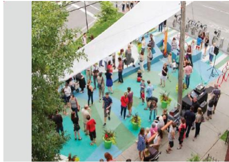
Piétonnisation d'une bretelle d'accès Place Villeray (2015) Arr. Villeray–Saint-Michel–Parc-Extension