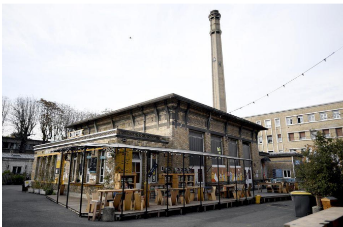
Site des Grands Voisins, Octobre 2018 article de Libération

L'essor de cet urbanisme, est une réponse au prolongement de la durée des projets urbains qui s'est rallongée, atteignant dix à quinze ans pour certains et créant ainsi des terrains en attente d'usage. Par exemple à Paris, l'ancien Hôpital Saint-Vincent-de-Paul fermé en 2012 se voit occupé par un ensemble d'associations appelé Les Grands Voisins . Cette appropriation a permis de reconsidérer les opportunités que contient un tel espace et de lui donner une nouvelle orientation. En effet, une crèche, un gymnase ainsi qu'une école sont les axes structurants du nouveau projet et non la vente de ce terrain à un promoteur immobilier.